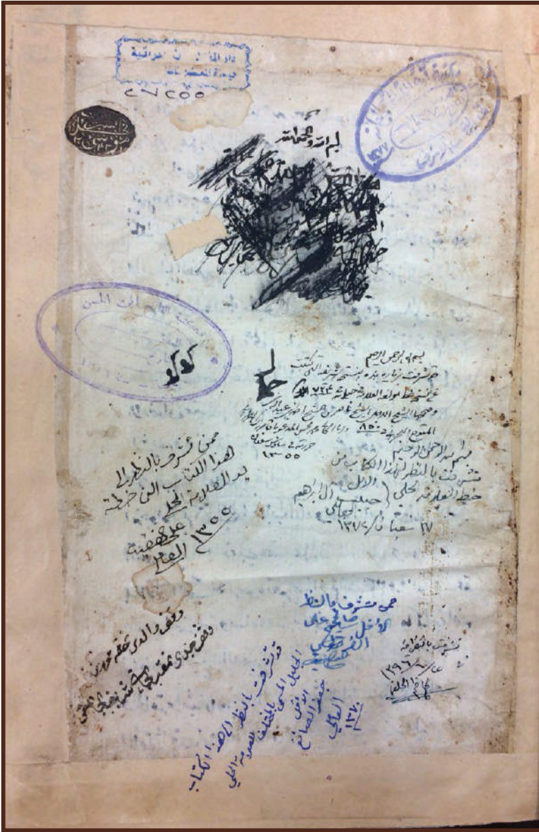
وجه النسخة ويظهر فيه خطوط العلماء الذين تشرفوا برويتها